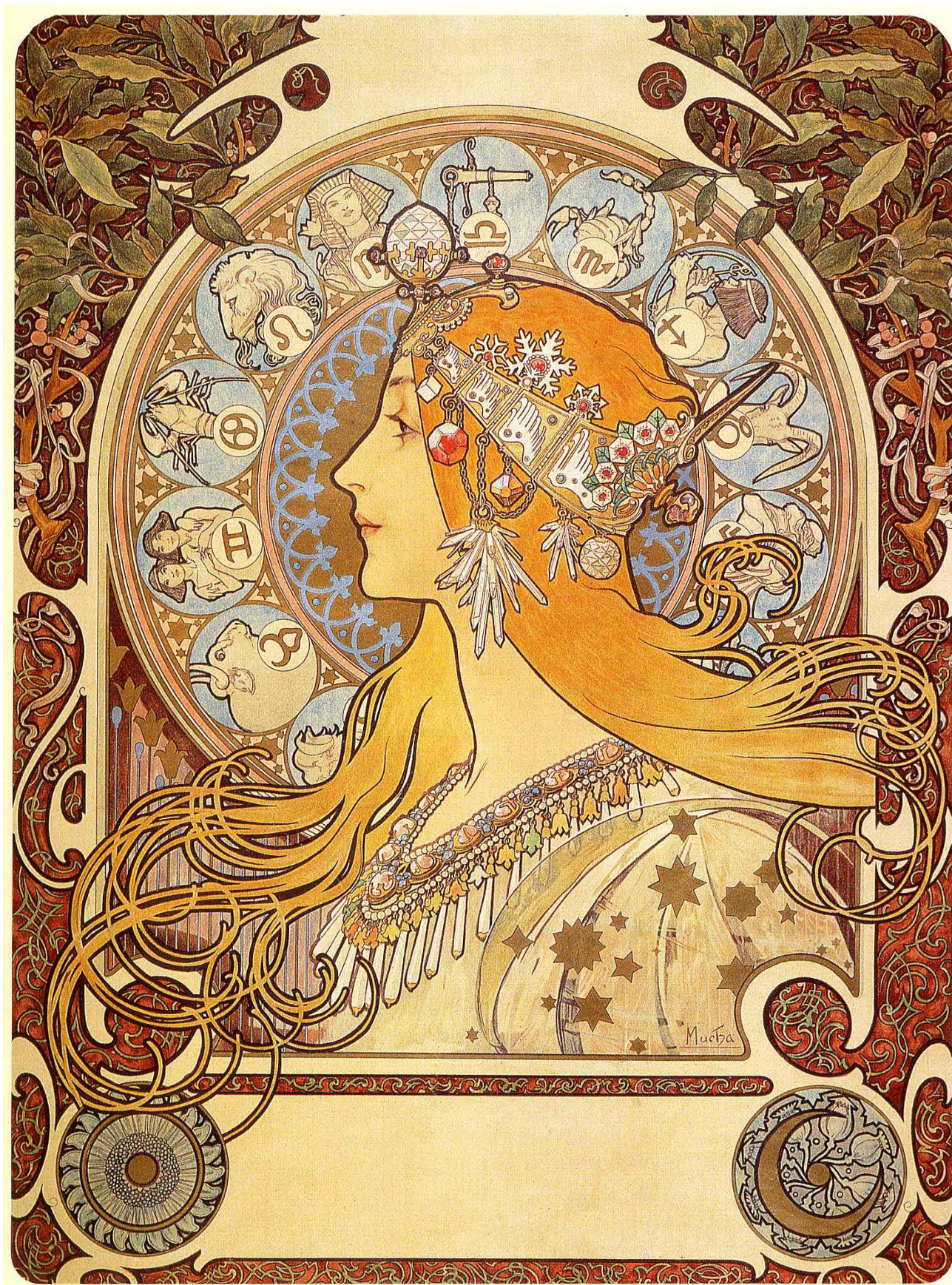
Zdroj: Mucha, A. Zodiac. 1896. wikiart.org [15. 12. 2014].